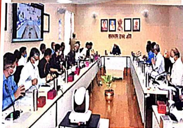
निधि की प्रबन्ध समिति की 48वीं बैठक दिनांक 16 सितम्बर 2021

माननीय श्री राज्यपाल द्वारा NDA/IMA/OTA/AF Academy/Naval Academy/Women Entry में जे0सी0ओ0 रैंक तक के पूर्व सैनिकों/उनकी विधवाओं की पुत्रियों को बढ़ावा देने के उद्देश्य से उक्त योजना में टाटा ट्रस्ट द्वारा दी जाने वाली धनराशि ₹ 1,00,000/- के अतिरिक्त निधि से भी ₹ 50,000/- प्रति आश्रित (पुत्री) की दर से अधिकतम दो पुत्रियों को एकमुश्त आर्थिक सहायता प्रदान किये जाने का निर्णय लिया गया है।