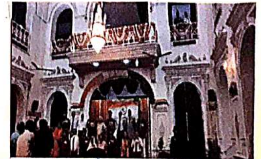
आजादी का अमृत महोत्सव